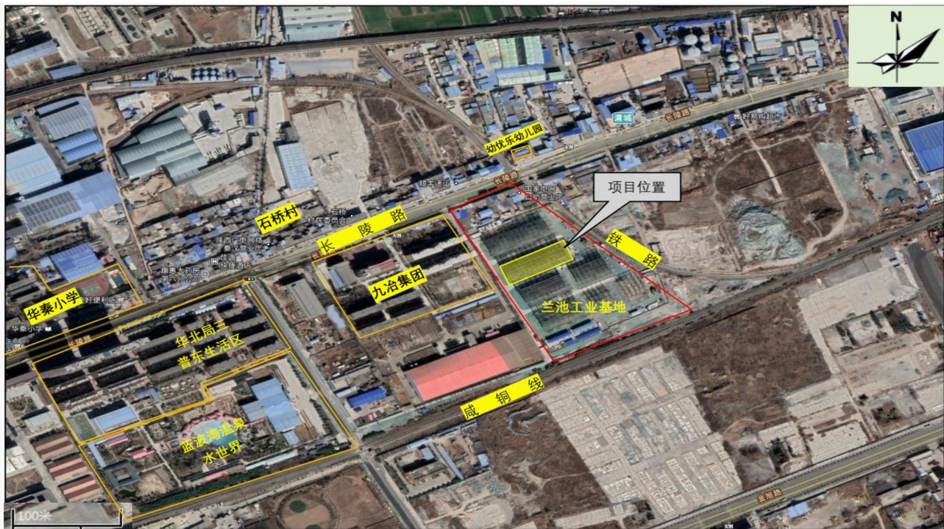
附图 2 项目敏感目标图