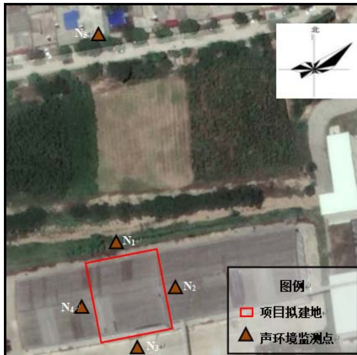
图2 声环境质量现状监测点位图

监测结果表明，本项目厂界四周和北侧黄家窑村的昼、夜间监测结果均符合《工业企业厂界环境噪声排放标准》（GB12348—2008）2类区噪声标准要求。