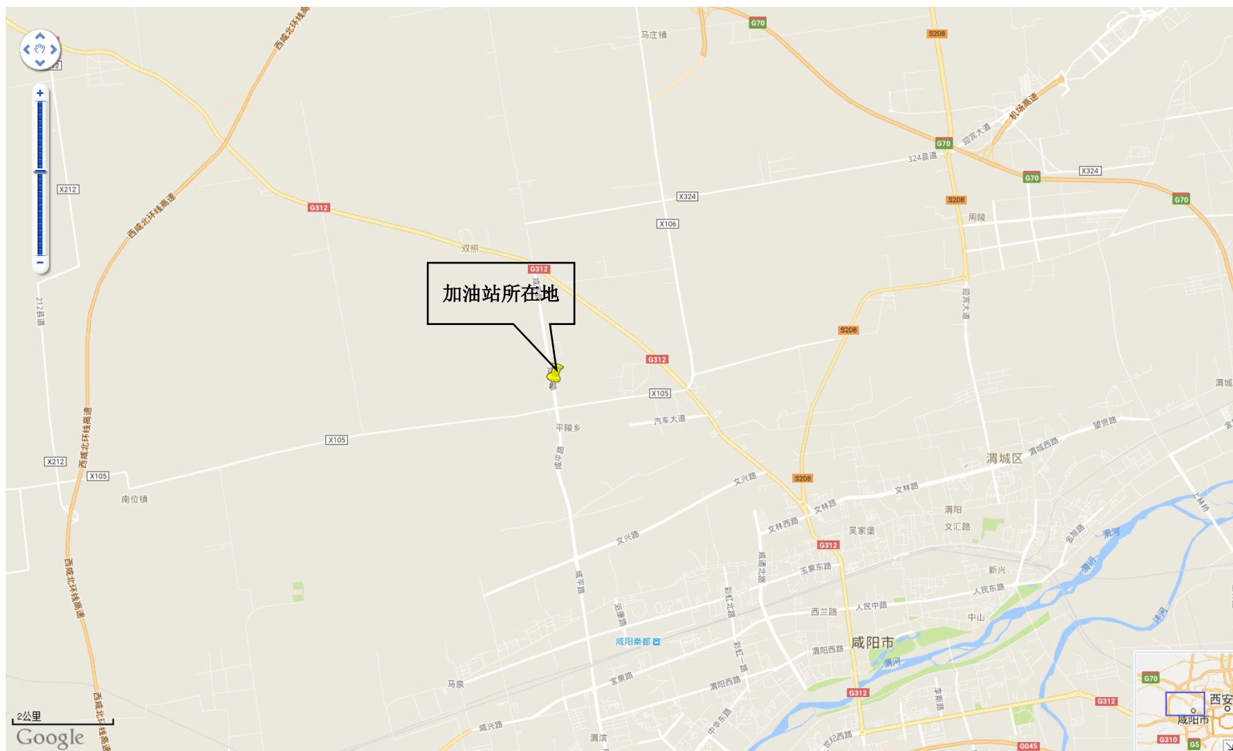
附图 1 加油站地理位置图