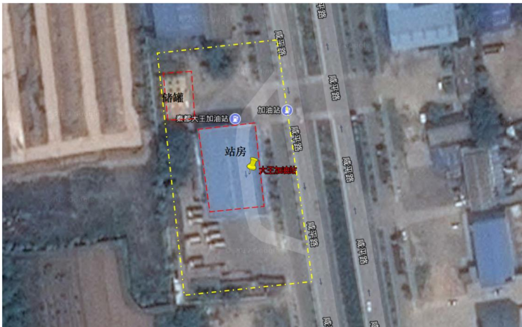
附图 2 平面布置图