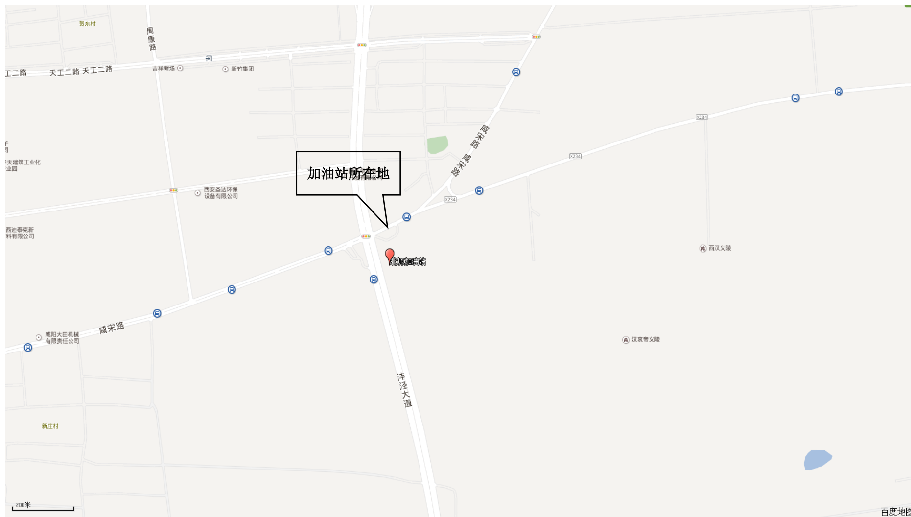
附图 1 加油站地理位置图