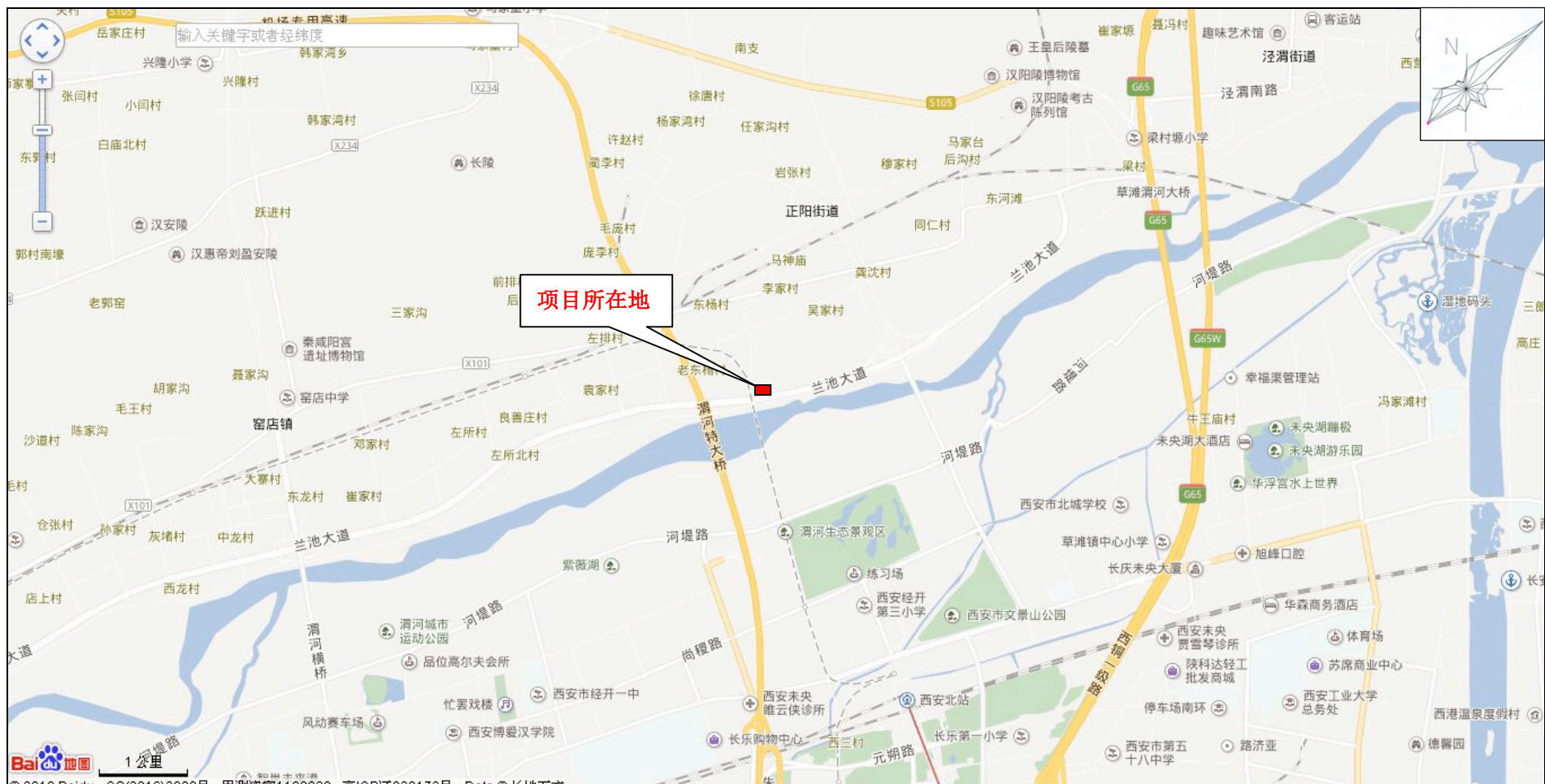
附图 1 项目地理位置图